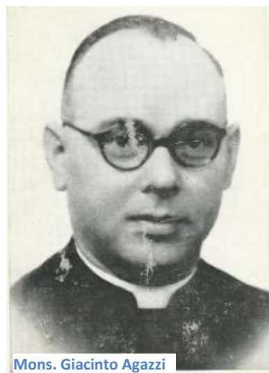
Mons. Giacinto Agazzi