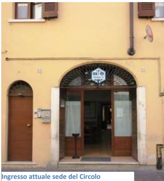
Ingresso attuale sede del Circolo